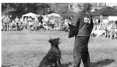
Holländischer Schäferhund Club in Hanau Der Holländische Schäferhund Club in Hanau ist ein Verein, der sich der Zucht und Erhaltung der Rasse widmet. Der Club hat eine lange Tradition und ist ein wichtiger Bestandteil der Rassezucht in Deutschland. Die Mitglieder des Clubs sind engagiert und arbeiten zusammen, um die Qualität der Zucht zu gewährleisten und die Rasse zu fördern. Der Club organisiert auch Veranstaltungen und Ausstellungen, um die Öffentlichkeit über die Rasse zu informieren.

er Rassehund" - Das Magazin des VDH - Ausgabe 09/13