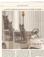
Lebhaft für vorliegende Veranstaltung von Präsidenten Pfaffen Die Veranstaltung wurde von den Präsidenten der verschiedenen Vereine organisiert und war ein großer Erfolg. Die Teilnehmer waren sehr zahlreich und es wurde viel über die Rasse diskutiert. Die Veranstaltung war ein wichtiger Schritt in der Entwicklung der Rasse und wir hoffen, dass sie in Zukunft noch mehr Menschen für die Rasse begeistern wird.